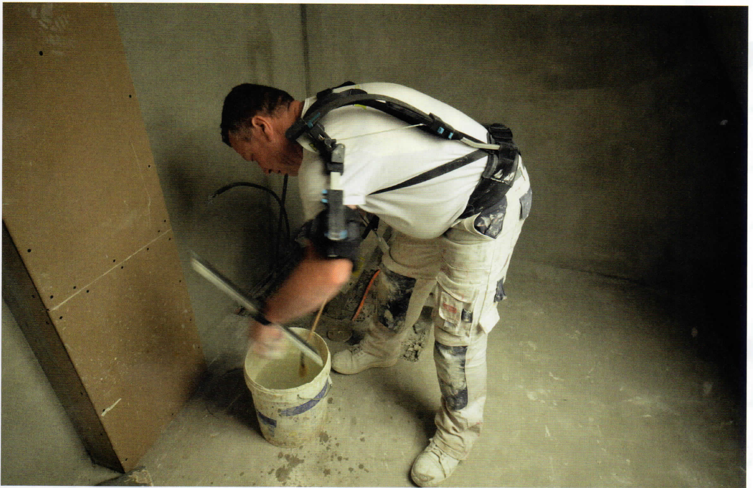
Bij werkzaamheden lager dan de schouder is het voordeel voor stukadoor minder expliciet.

werkzaamheden boven de schouder wil ik het product zeker permanent blijven gebruiken.”