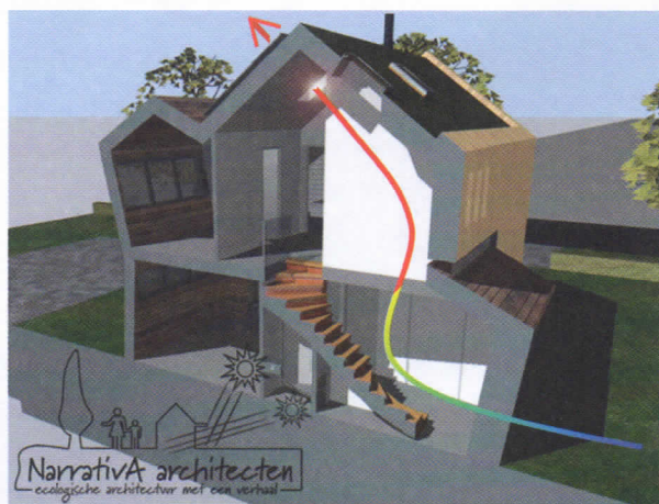
Nachtventilatie is ideaal voor het laten afkoelen van een houtskelbouwconstructie.

Een gunstige faseverschuiving begint bij een zonbewust ontwerp van een houtskelbouwwoning. Het motto daarbij is het beperken van maximale zontoetreding in de gebouwschil. Door het treffen van bovengenoemde maatregelen kan dat doel worden bereikt.