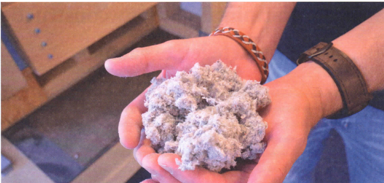
Groenhart Houtskeletbouw ziet dat een met cellulose geïsoleerd houtskelet een gunstig effect heeft op de faseverschuiving.

binnenzijde en houtvezelplaat aan de buitenzijde. Daardoor worden het verschil tussen de minimum- en maximumtemperatuur (thermische amplitude) en de schommeling van de binnentemperatuur zoveel mogelijk gedempt.