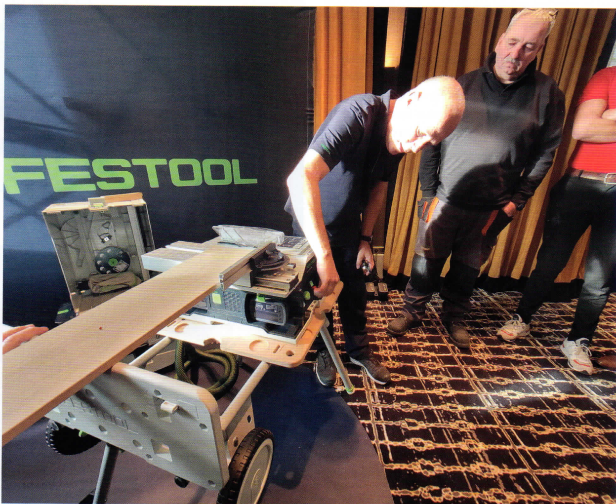
De demonstratie van de nieuwe zeer compacte accu-zaagtafel maakte indruk op de bezoekers van de roadshows.

De nieuwe accu-zaagtafel CSC SYS50 maakte indruk op de recente roadshows van gereedschapsfabrikant Festool. De multifunctionele zaagtafel is zo compact dat die in een systainer past, terwijl werkblad, onderstel en steekwagen tot één geheel gecombineerd zijn. De zaagtafel heeft zeer precieze zaaginstellingen met digitale bediening.