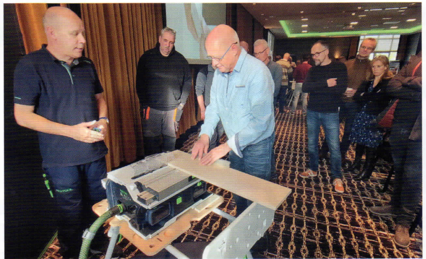
Bezoekers van de roadshow mochten de machine zelf uitproberen.

Het middelpunt van de machine is het digitale display met draaiwiel en twee aan de zijkant geplaatste groene knoppen. Hoogte en hoek worden met één druk op de knop elektrisch tot op de tiende mm of inch ingesteld. De parallelaanslag met dubbele klemming en hoekaanslag met schuifslide zorgen voor uiterste precisie. Verstekhoeken tussen -70 en +70° zijn mogelijk.