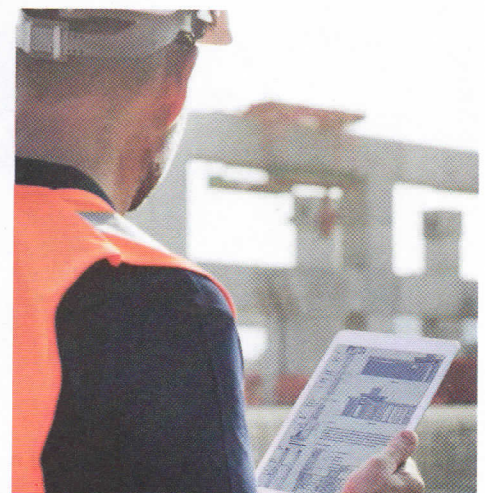
Eén app voor bouwer en kwaliteitsborger.