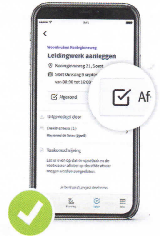
Een vinkje zetten als een klus is geklaard.